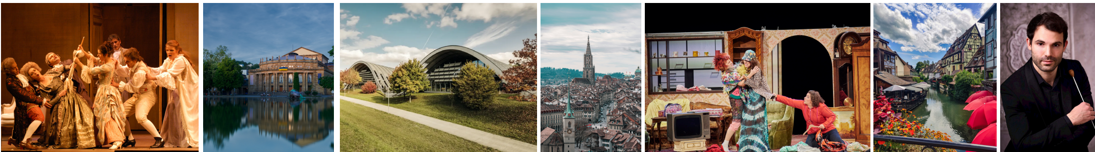
Les Noces de Figaro © D.R | Opéra de Stuttgart © D.R. | Zentrum Paul Klee © D.R. | Berne © D.R | La Cenerentola @ Martin Sigmund | Colmar © D.R. | Clément Lonca © Karol Miczka