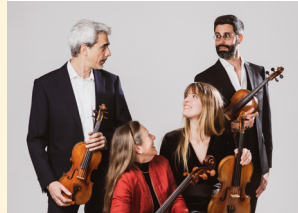
Quatuor Ludwig