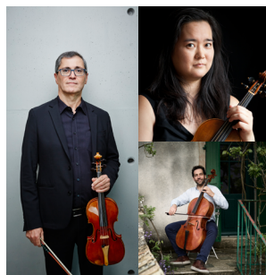
Laurent Lagresle Mario Konaka Pierre Charles