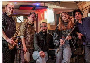
Brazilian Stories