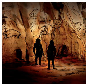
Chronique du Pont d'Arc