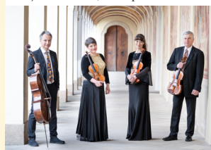
Quatuor Pražák