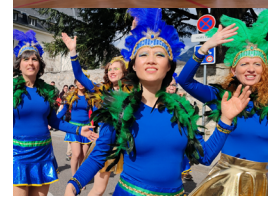
Bouge ton dende