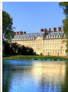
Philharmonie Luxembourg | J. Kaufmann, D. Damrau, H. Deutsch | Bruges quartier du canal vert | Carmen au Théâtre de la Monnaie | Le Carnaval baroque | Opéra Royal de Versailles | Château de Fontainebleau